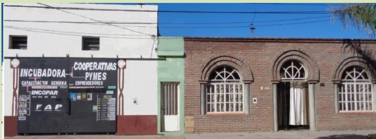
Calle Luciano Torrent = Incopar 1817 y 1823 , Estudio 1833 - Ciudad de Santa fe - República Argentina

SI HA SIDO DE TU INTERES, ESPERAMOS TU VISITA