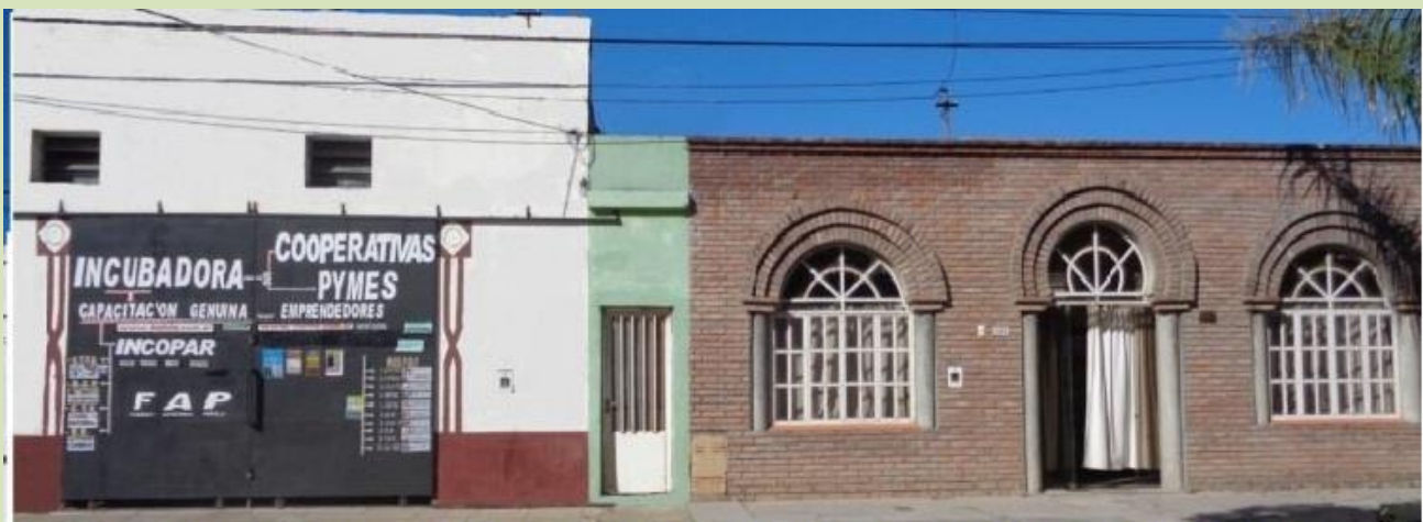
Calle Luciano Torrent = Incopar 1817 y 1823 , Estudio 1833 - Ciudad de Santa fe - República Argentina

SI HA SIDO DE TU INTERES, ESPERAMOS TU VISITA