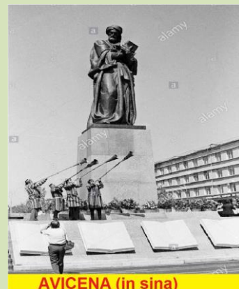
AVICENA (in sina)

Obvio que YO LOS RESCATO y los potencio , pero no como turista, sino como MILITANTE de las Ciencias , al igual que lo hago con muchos otros como AVERROES , el “magnífico AVICENA” , MAIMONIDES , o el creador del método científico , según los rusos, que fue AVEMPACE y otros de mis preferencias como Pitágoras.