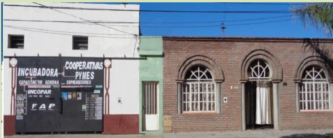
Calle Luciano Torrent = Incopar 1817 y 1823 , Estudio 1833 - Ciudad de Santa fe - República Argentina

SI HA SIDO DE TU INTERES, ESPERAMOS TU VISITA